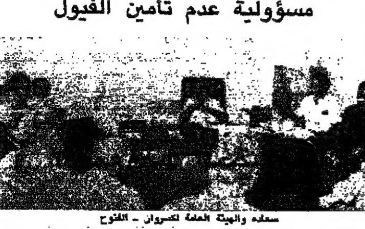
سعاده والهيئة العامة لكسروان - الموضع

وقد هذه الهيئة الحكومية الى مواجهة هذه الكثرة سببه لتسليمها لبقية السلطة مكتوفة الايدي تجاه ما يحصل في المنطقة.